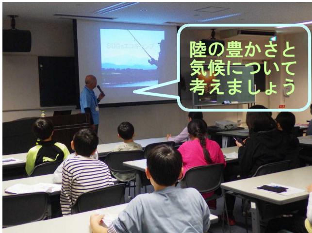
陸の豊かさと気候について考えましょう