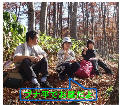
ブナ平でお昼だよ