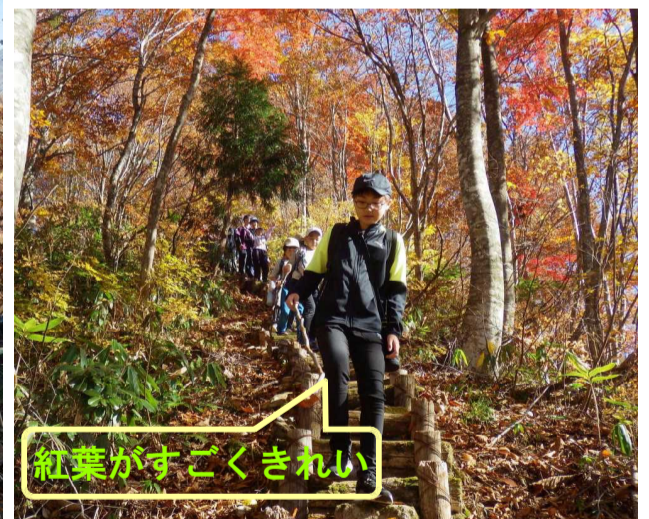
紅葉がすごくきれい