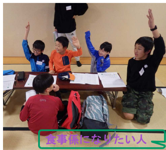
食事係になりたい人