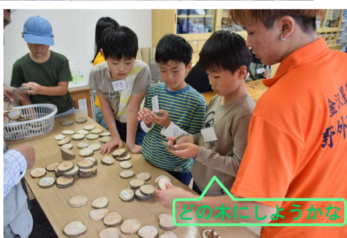
どの木にしようかな