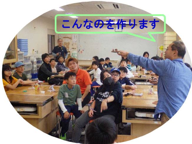
こんなのを作ります