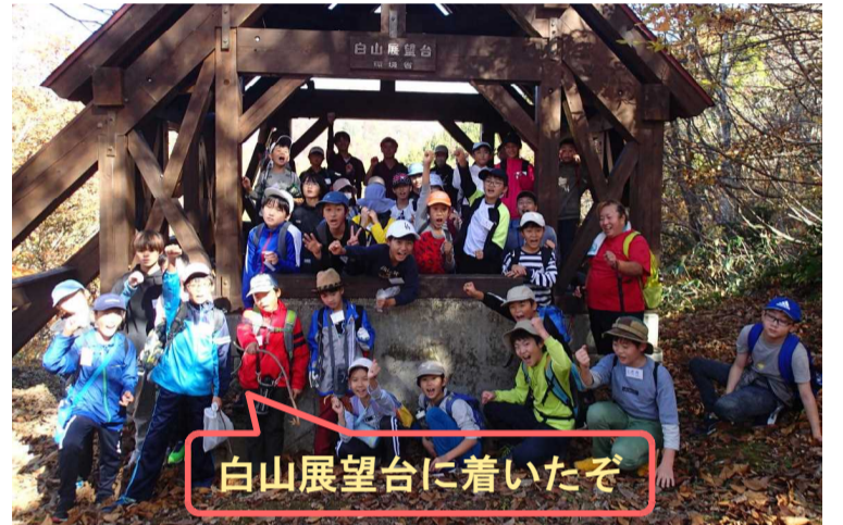
白山展望台に着いたぞ