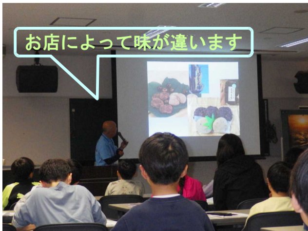
お店によって味が違います