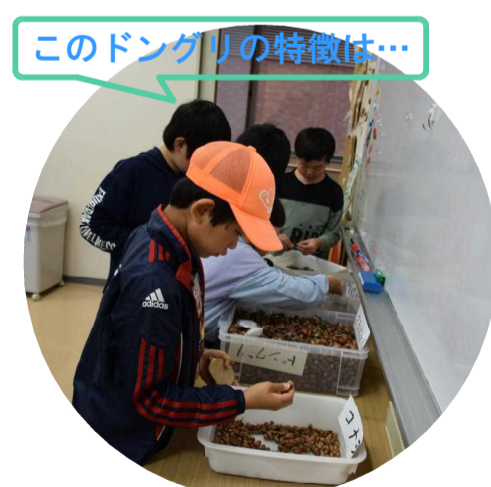
このドングリの特徴は...