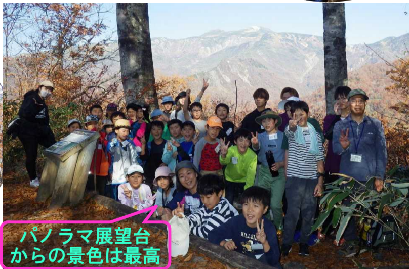
パノラマ展望台からの景色は最高