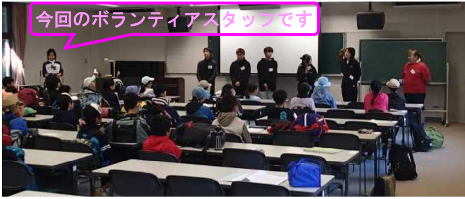
今回のボランティアスタッフです