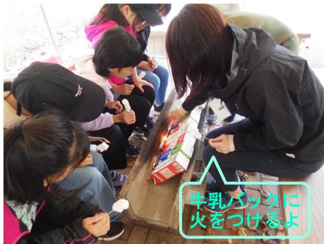
牛乳パックに火をつけるよ