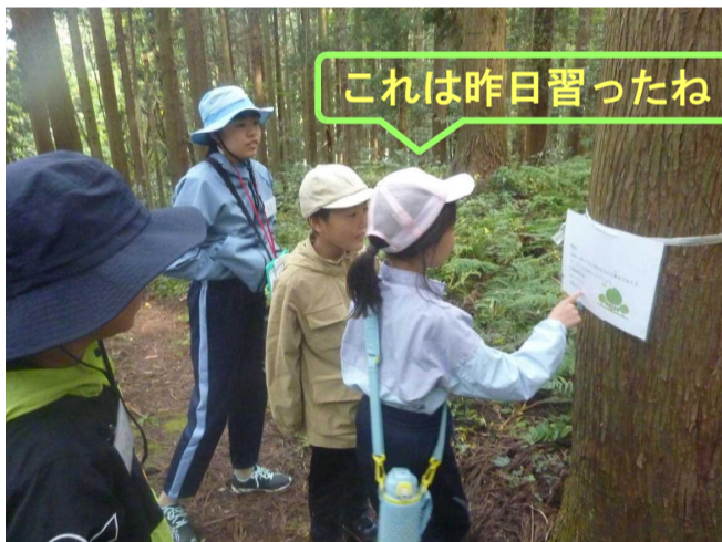
これは昨日習ったね