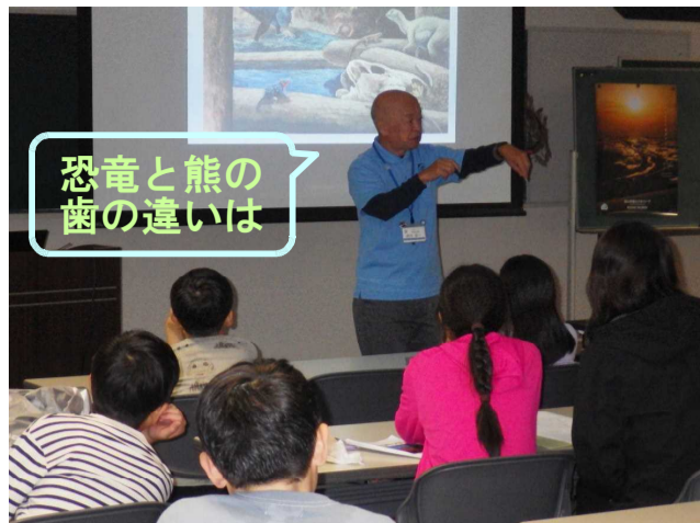
恐竜と熊の歯の違いは