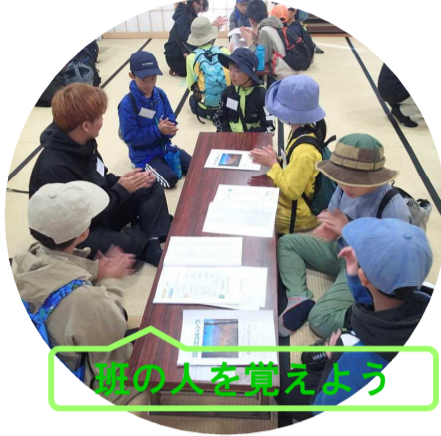
郷の人を覚えよう