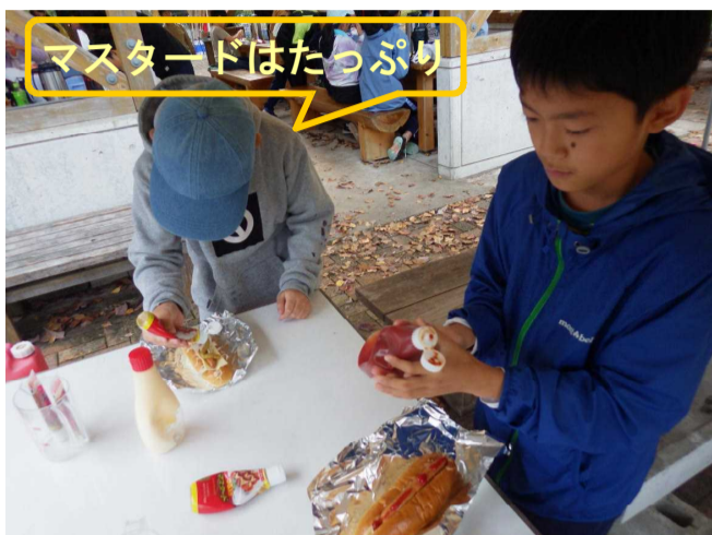
マスタードはたっぷり